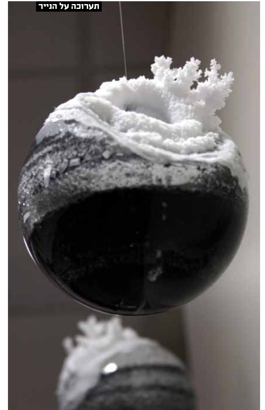
תערוכה על הנייר